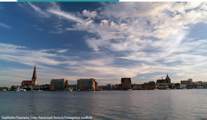
Stadthafen Panorama

Berufsverband der Kinder- und Jugendärzt*innen e.V.